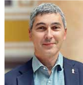
Jordi Roca Ventura

Actualment: Alcalde d'Albinyana des de 1999. Diputat provincial a la Diputació de Tarragona. Vicepresident primer de la Diputació de Tarragona i Diputat d'Hisenda.